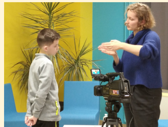
APPRENTISSAGE DU CADRAGE AVEC DES ÉLÈVES DE CINQUIÈME CLASSE ULYSSE (BRUAY-SUR-L'ESCAUT, 2022)