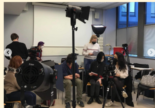
FORMATION AU CADRAGE ET À LA LUMIÈRE AVEC LES ÉTUDIANTS (ÉCOLE NORMALE SUPÉRIEURE DE LYON, JANVIER 2021)

Nos ateliers permettent de CRÉER DU LIEN SOCIAL par le travail artistique collectif au sein d'une classe, d'un groupe, ou d'une communauté. RENDRE ACCESSIBLE à toutes et tous les pratiques créatives à travers la manipulation d'outils technologiques et numériques et ÉVEILLER LES PUBLICS aux enjeux du visionnage des images et de l'écoute sonore sont les objectifs premiers des ateliers proposés par À l'Affût.